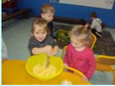
Bonnes vacances à tous ! Les PS/MS